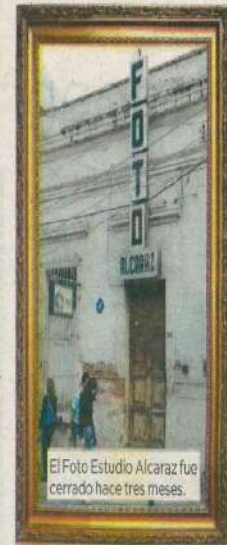
El Foto Estudio Alcaraz fue cerrado hace tres meses.