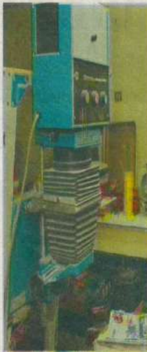
Una amplidora es testigo de los mejores tiempos del estudio.

Se maravilló con el mundo de la fotografía. El cuarto oscuro se volvió parte de su vida. A prueba y error buscó siempre la