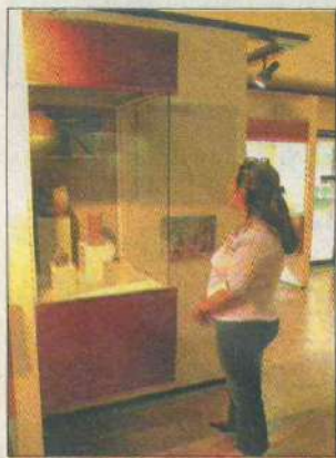
El Museo Regional de Sinaloa exhibe una serie de "tesoros" arqueológicos.