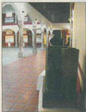
El Masin muestra exposiciones permanente e itinerantes para sus visitantes.

La ciudad ofrece diversos lugares para entretener a chicos y grandes