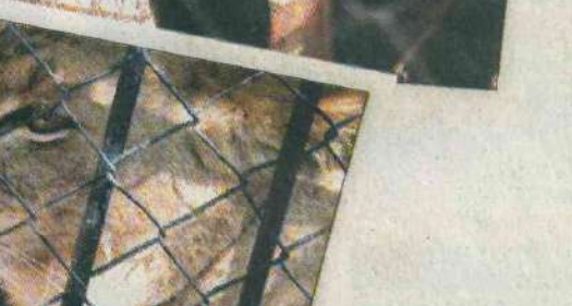
El Zoológico es sede de más de 130 especies de animales.