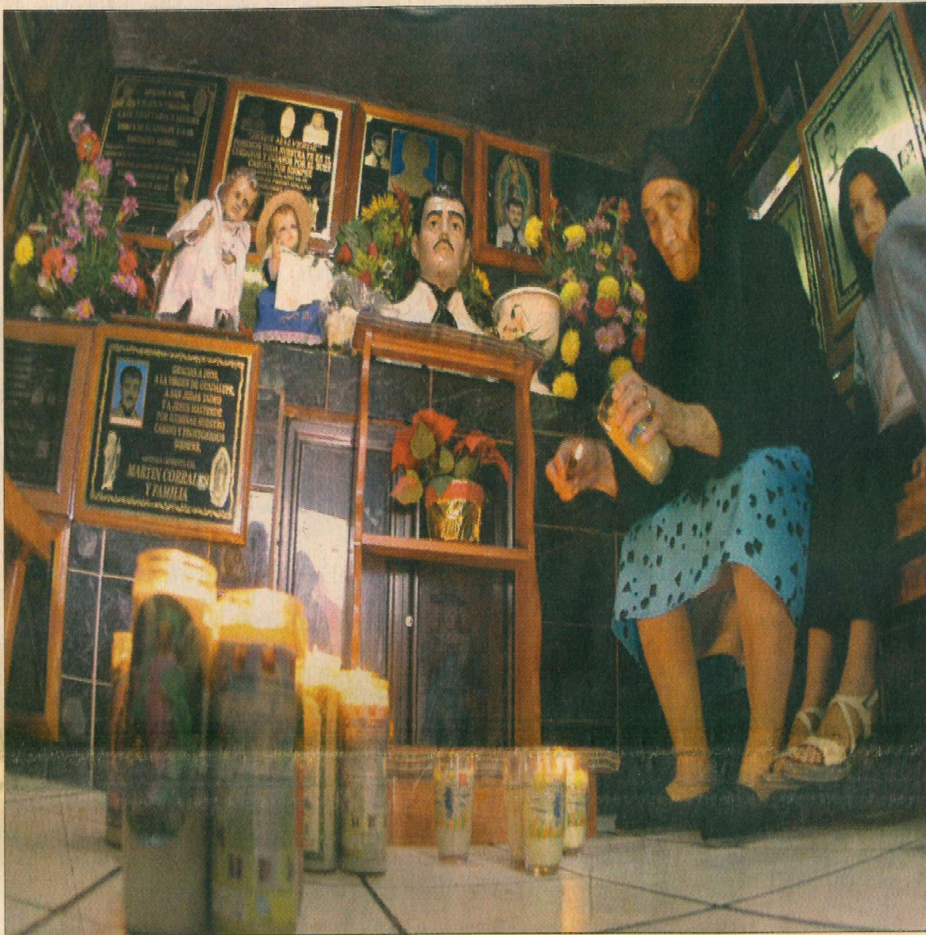
EN LA capilla, los fieles le rinden culto con veladoras y flores.

“Mi propuesta es que Malverde es un proceso de creación incesante no determinada exclusivamente por nada ni por nadie, es decir, por lo social, histórico o lo síquico de figuras