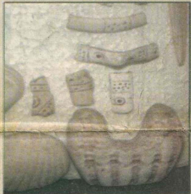
EL RECUERDO de los antiguos pobladores permanece más vivo que nunca.

de recoger raíces naturales, que encuentra a las orillas de los ríos, arroyos.