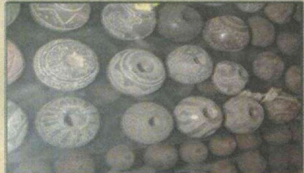
CIENTOS DE figuras prehispánicas se exhiben en el museo del Chino Billetero.