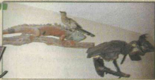
DIVERSIDAD DE animales disecados se encuentran a la vista de los espectadores.