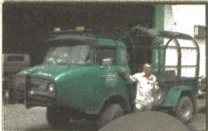
EN SU peculiar vehículo emprende cada fin de semana viajes para recolectar vestigios históricos.

Abre las puertas de su casa y el cantar de las palomas regala sonidos hermosos, "es que saben cuando entro a mi hogar".