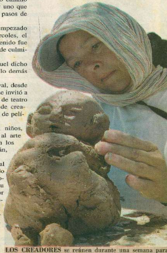
LOS CREADORES se reúnen durante una semana para realizar sus obras.

Sobre la arena, un grupo danzaba junto al mar, los colores del día se habían ido.