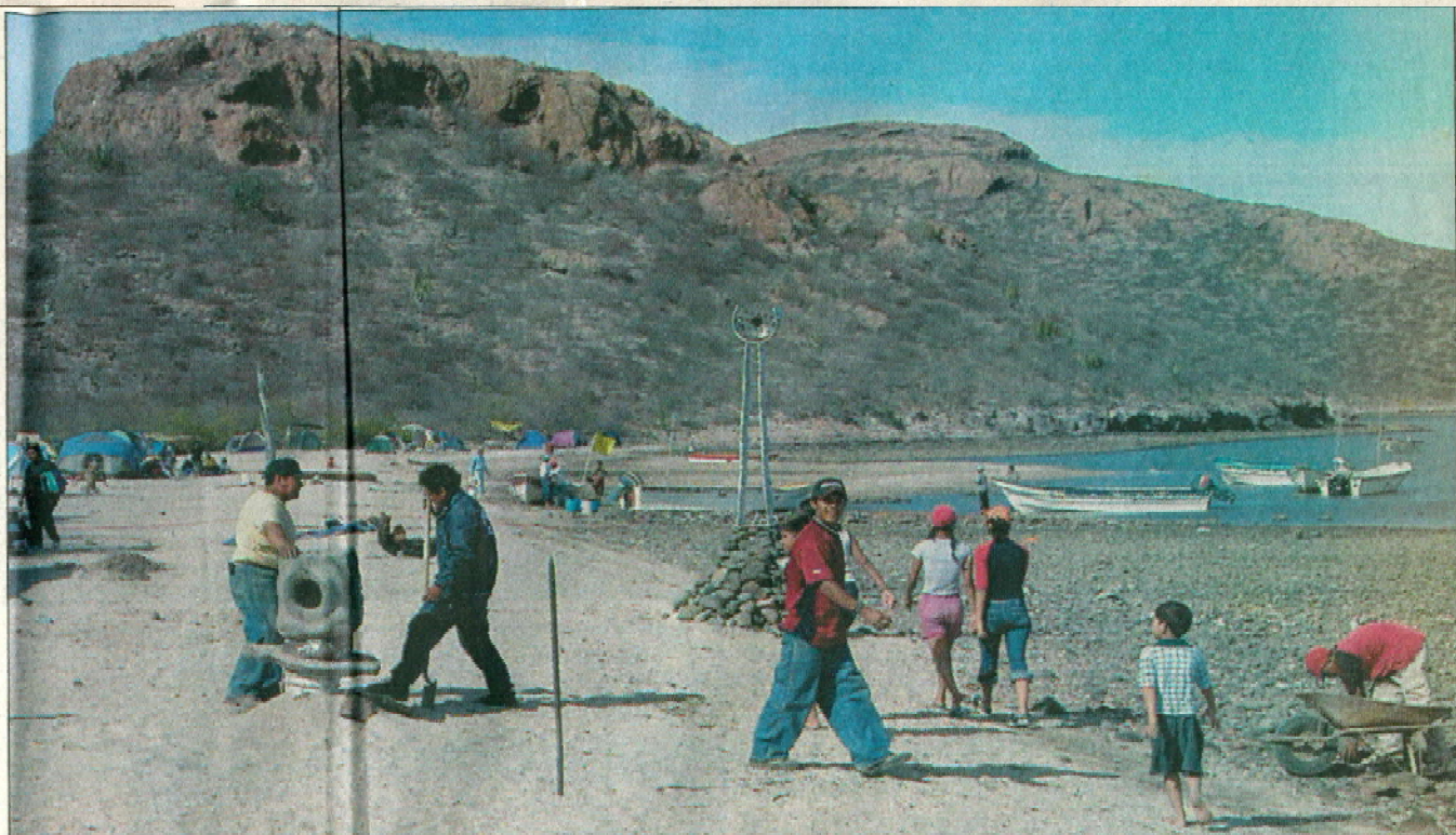
EL LUGAR inspira a los artistas y reanima a sus habitantes.