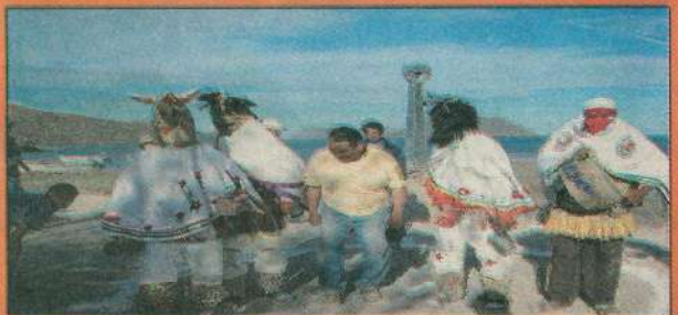
LA LLEGADA de los judíos al lugar.