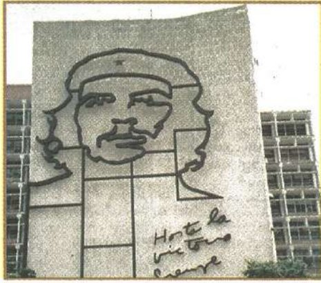
EL PARAÍSO ideal por el que pelearon los revolucionarios, no se logra.

Si el Comandante hubiera realizado su labor con el respeto que se merecen los que lucharon